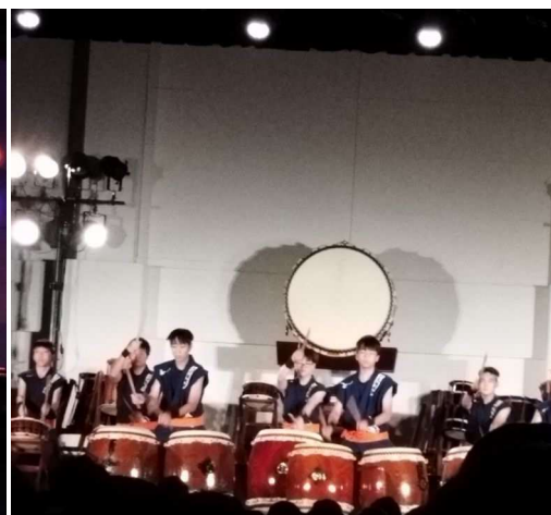
子どもたち50人の叩き