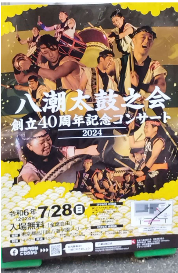
八潮学園で行われた八潮太鼓之会